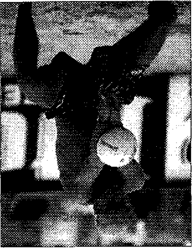
(fortsættes på side 3)

sidste år afviklet i Lyngehallen søndag, den 9. april. Det ville være rart, hvis klubbens "ikke-mixmedlemmer" vil bakke op om dette arrangement bl.a. som officials.