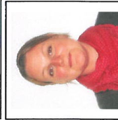
Line Krog West Hold 6 og 19